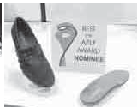
(株)シャミオールの靴