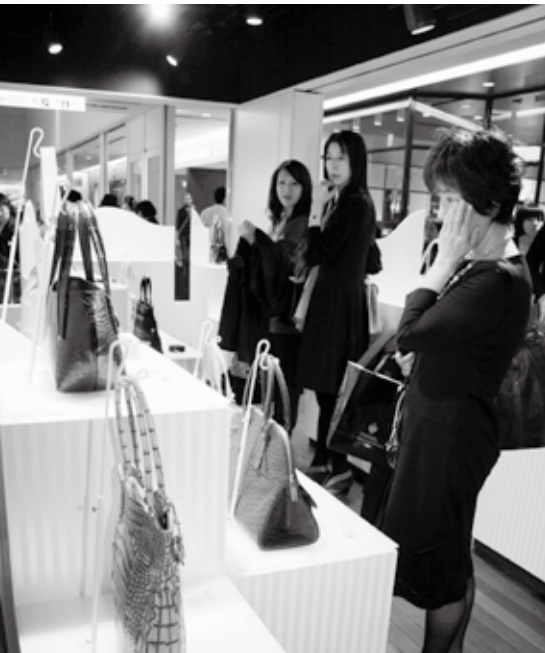
エクラとのコラボレーションで完成したバッグも並んだエキゾチックレザー展